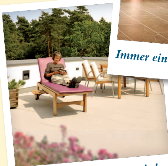
Am liebsten ganz oben sein!