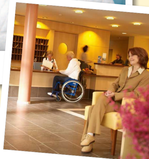
Immer ein warmer Empfang