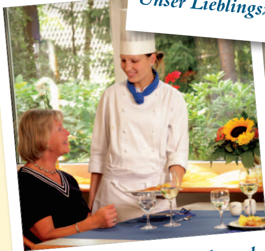
Das trifft meinen Geschmack